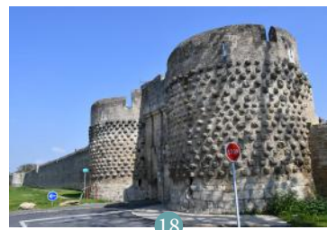
18 Porte Saint-Jean