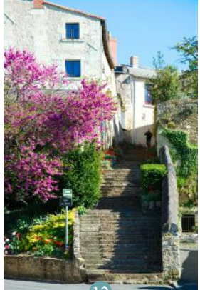
12 Escalier Saint-Pierre