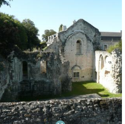
11 Ruines de l'église Saint-Pierre