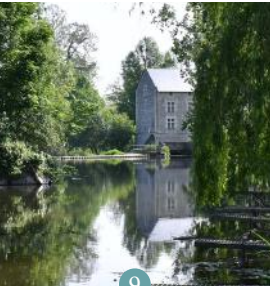
9 Moulin à eau