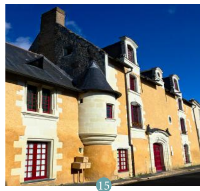
15 Maison Dovalle