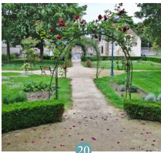
20 Jardin botanique