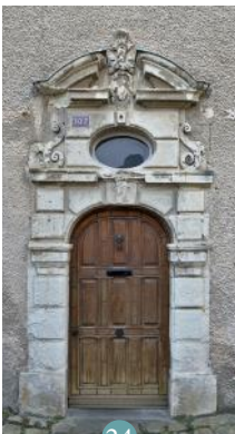
24 Porte du XVIIe siècle