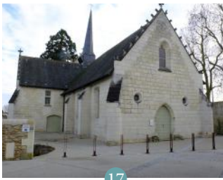
17 Hôpital Saint-Jean