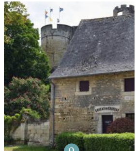
9 Chai du Château