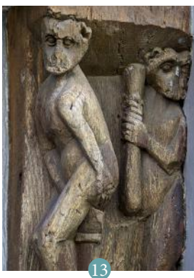
13 Sculpture - Maison de l'Apothicaire