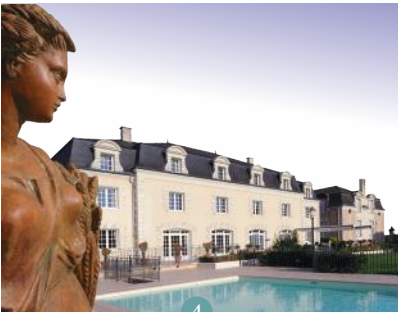
4 Relais du Bellay