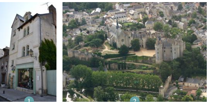
1 Ancien greffe de la Baronnie