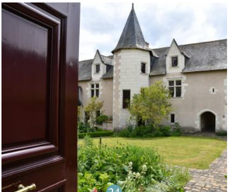
24 Hôtel particulier Le Clos Gaudrez