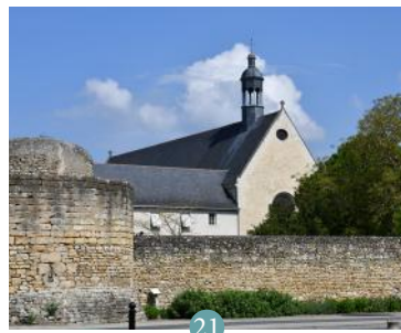
21 Eglise des Grands Augustins