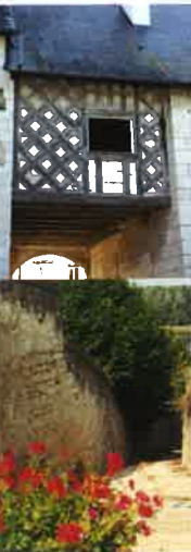
RUELLE DES LAVANDIERES